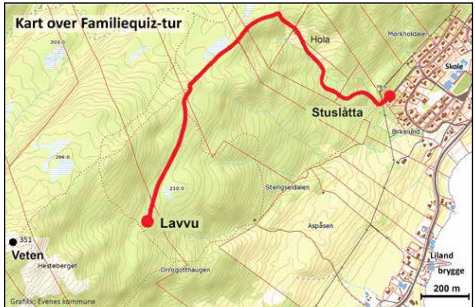
Kart over trasé Familiequiz-tur.