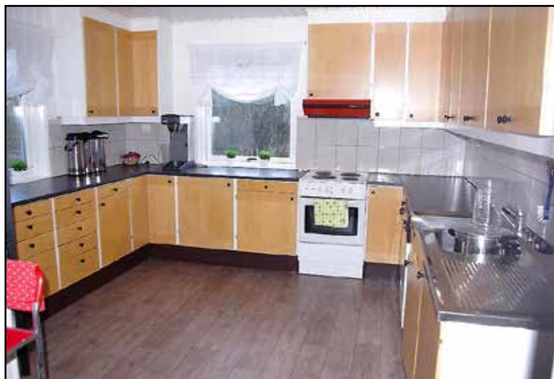
Kjøkken Lakså grendehus